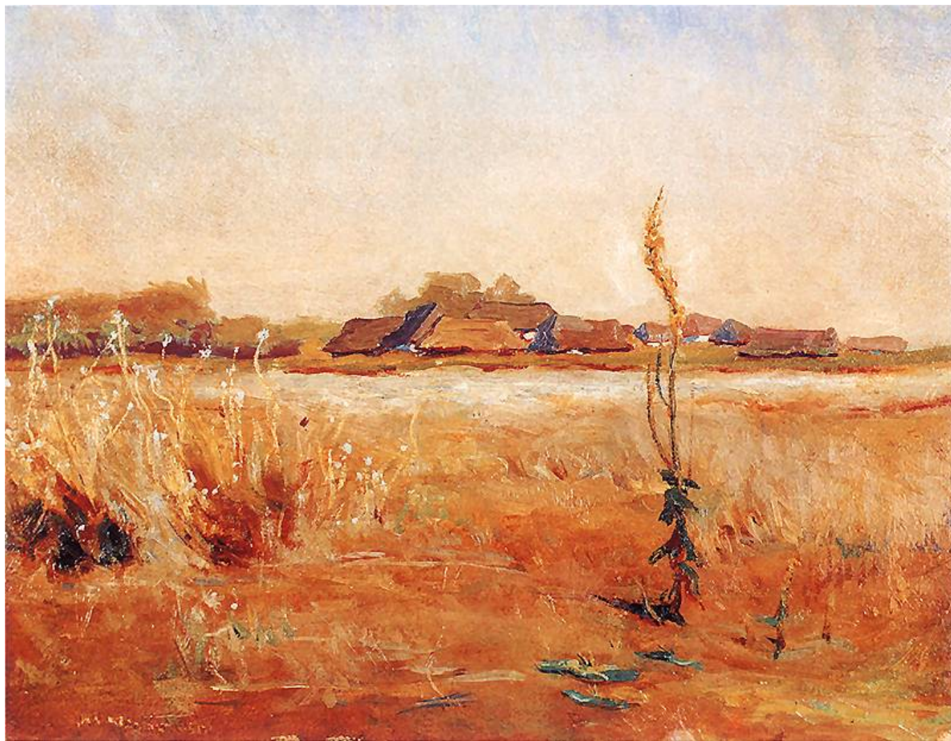
Jan Stanisławski, Wieś- Dziewanna, olej na desce 31,5 x 41 cm, własność prywatna.

Opowiadanie ukazało się w „Liscie oceanicznym”, dodatku kulturalnym do „Gazety” z Torontno w 2003 r.