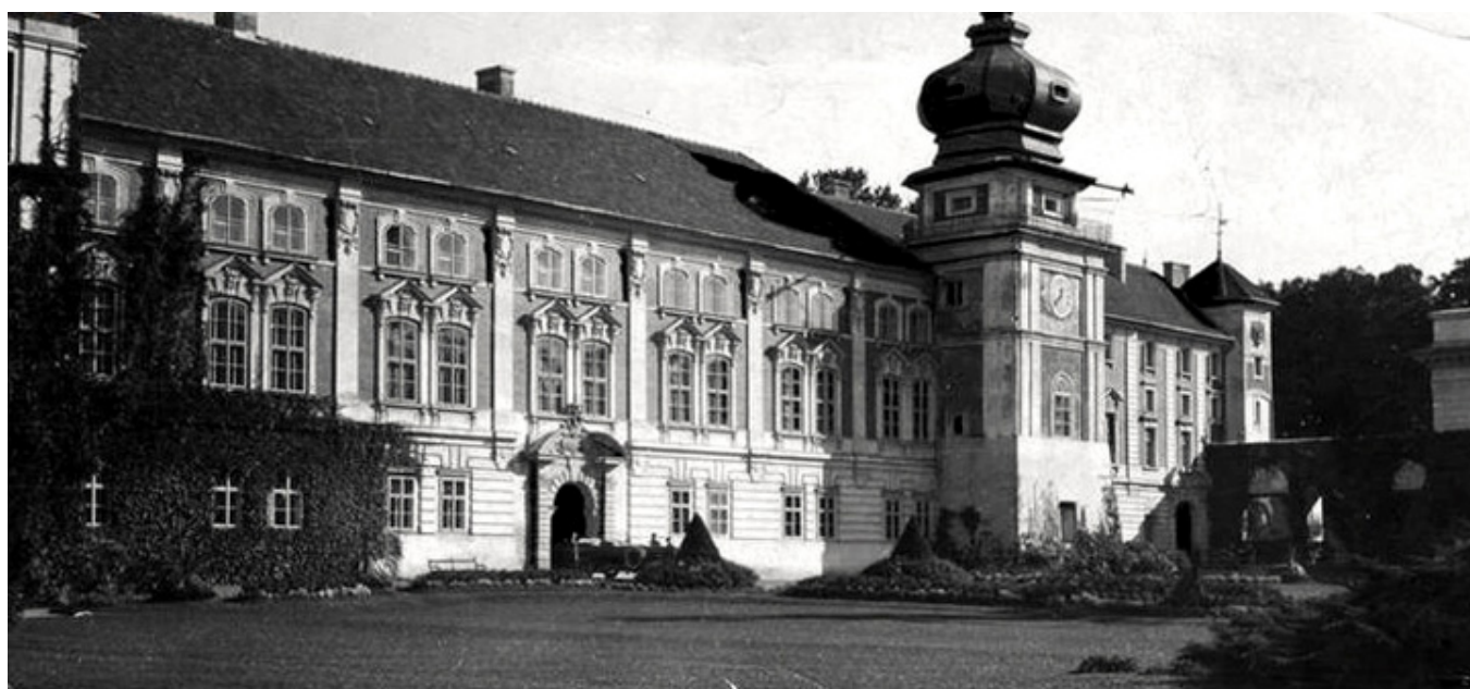
Zamek w Łańcucie w 1924 r., fot. 1-P-2131 / Narodowe Archiwum Cyfrowe.