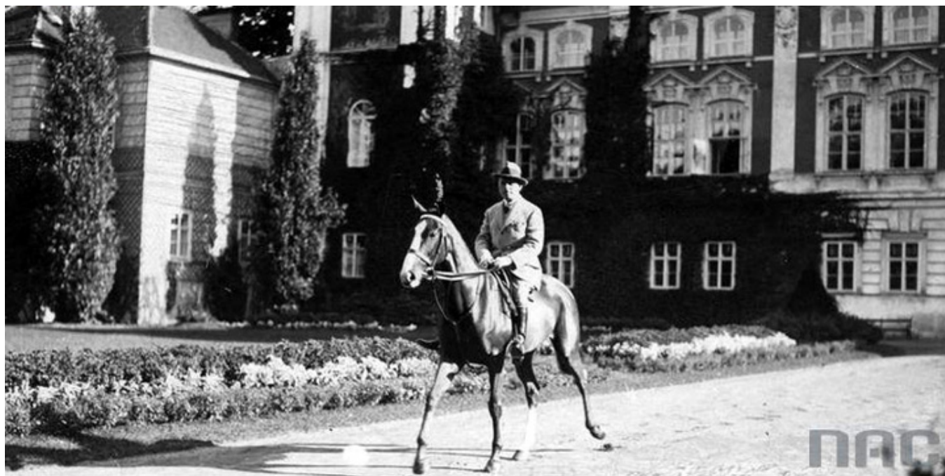
Hrabia Alfred Potocki podczas przejażdżki konnej przed pałacem, 1924 r.

ogłędzinach okazało się jednak, że sygnet był podrobiony. Półtrzecia krzyża na srebrnym polu, czyli Srebrna Pilawa, ma trzecią pałkę z prawej strony, a okazany przez domniemanego potomka pierścień, był niestety tylko lustrzanym odbiciem rodowego herbu.