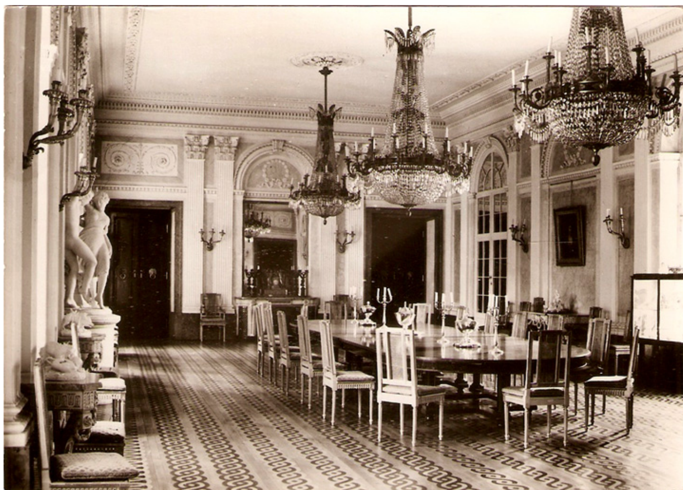
Biała Jadalnia na starej fotografii. Jadalnia położona obok Sali Balowej i Teatru pełniła funkcję reprezentacyjną. Tu odbywały się bankiety i tu byli przyjmowani dostojni goście.