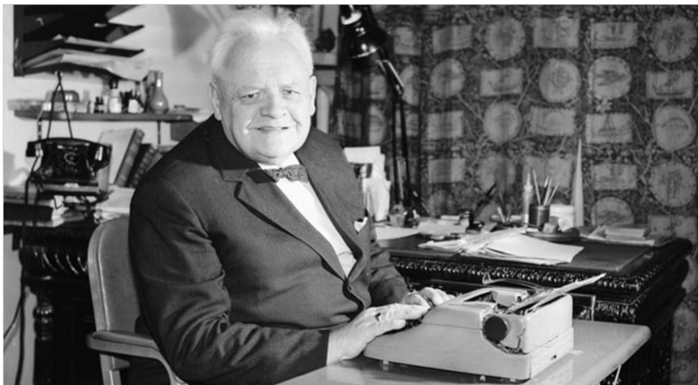
Melchior Wańkowicz przy pracy, Warszawa, 1963 r..