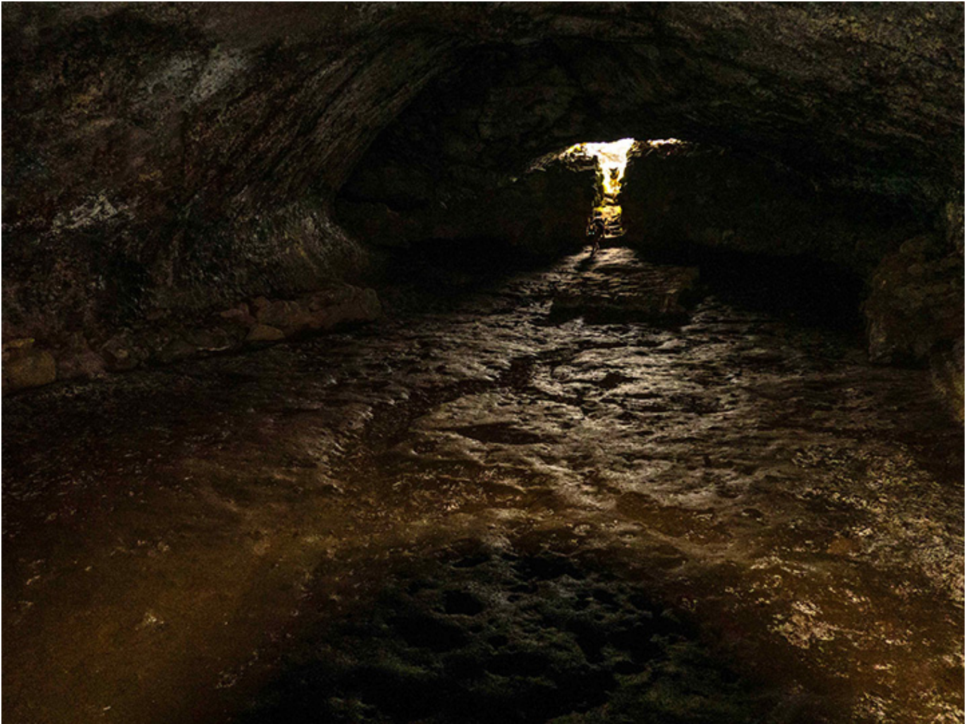
Podziemna grota ze źródłem, fot. Czesław Sornat