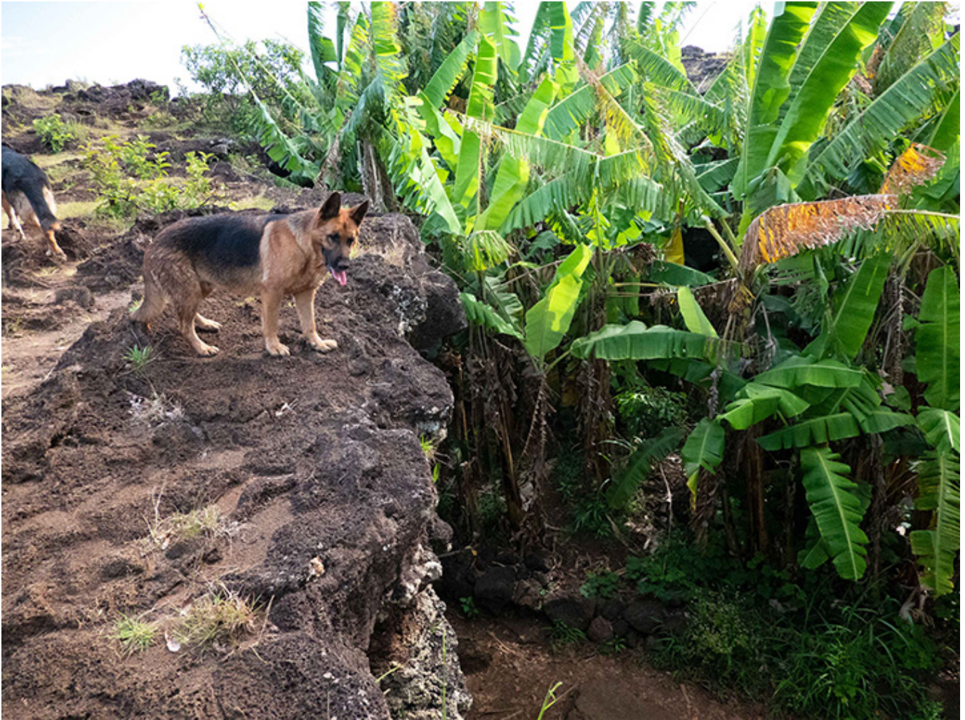
Podziemna oaza z bananowcami

Wilczury, które mnie prowadziły i pilnowały przez całą drogę, nagle zniknęły. Tak samo jak kobieta-zjawa. Były - puch! I już ich nie było. Przez długi czas je wołałem, szukałem, ale bezskutecznie. Nigdy więcej już ich nie zobaczyłem. Czyżby duchy Wyspy prowadzące zbłąkanego wędrowca?