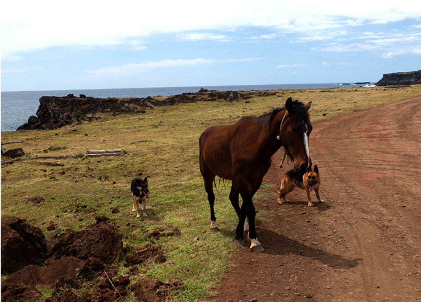
Koń i psy