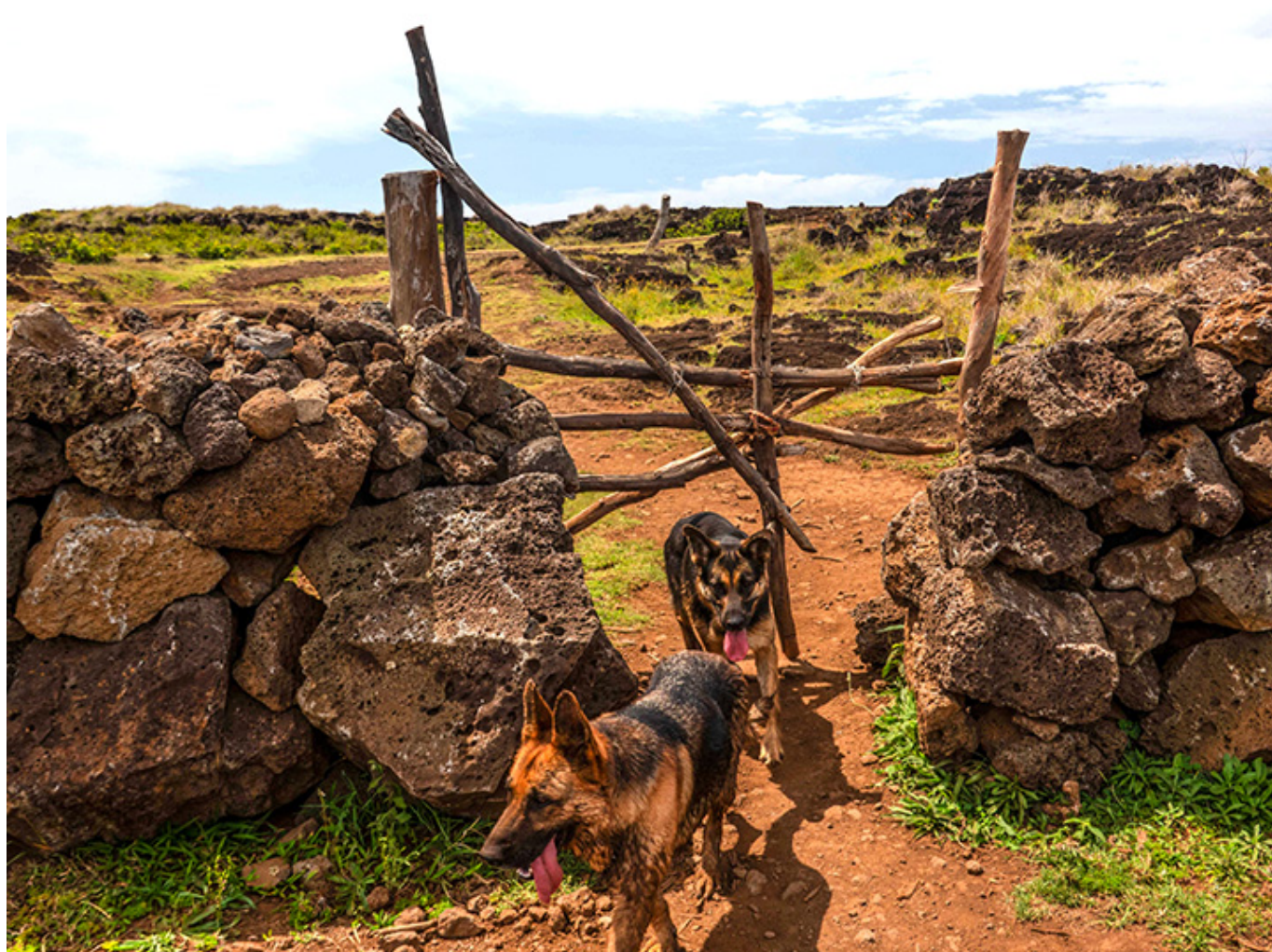
Spróchniała furтка